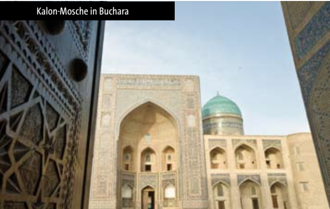
Kalon-Moschee in Buchara

Ganztägige Besichtigung in der Altstadt Itschan Kale: Westtore Ota Darvoza aus dem 17. Jh.; Minarett Kalta Minor , ein einzigartiges unvollendetes Minarett aus dem 19. Jh.; Amin-Khan-Medrese ; Ko'xna-Ark-Festung (17.-19. Jh.), die ehemalige Residenz der Khane aus Chiwa, Pahlavon-Maxmud-Mausoleum , das heiligste Mausoleum in Chiwa, Islom-Xo'ja Medrese mit dem 45 m hohen gleichnamigen Minarett , Toshxauli-Palast mit Harem, die in Zentralasien letzte erbaute Karawanserei aus dem 19. Jh. sowie die Juma-Freitagmoschee , aus dem 11. Jh. mit einer von 213 geschnitzten Säulen getragenen Holzbalkendecke.