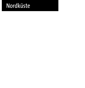
Camara de Lobos