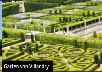
Gärten von Villandry

In Blois Besichtigung des Schlusses von Ludwig XII. und François I. Dieses Schloss bietet einen interessanten Überblick über die französische Architektur, da alle Stilepochen vertreten sind. Fahrt nach Amboise . Besichtigung des königlichen Schlusses über der Loire und des Clos-Lucé mit vielen technischen Modellen von Leonardo da Vinci. Abendessen und Übernachtung Tours .