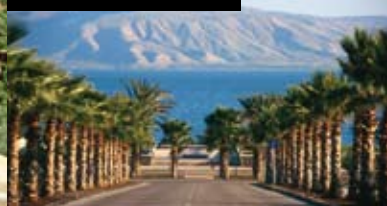
See Genezareth und Golan

( Lithostrotos ). Gang durch die Via Dolorosa zur Grabeskirche . Weiter durch das armenische und jüdische Viertel zum Cardo und zum Zionsberg : Abendmahlssaal, Grab von König David, deutsche Dormitio-Abtei. A/Ü Jerusalem .