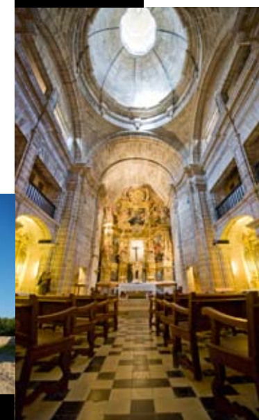
Kirche in Alcudia

Von hier bietet sich ein großartiger Blick über die ganze Insel. Das Kloster auf dem Gipfel beherbergt die holzgeschnitzte Madonna Mare de Deu del Toro, die Schutzpatronin der Menorquiner. Abendessen und Übernachtung Calagaldana .