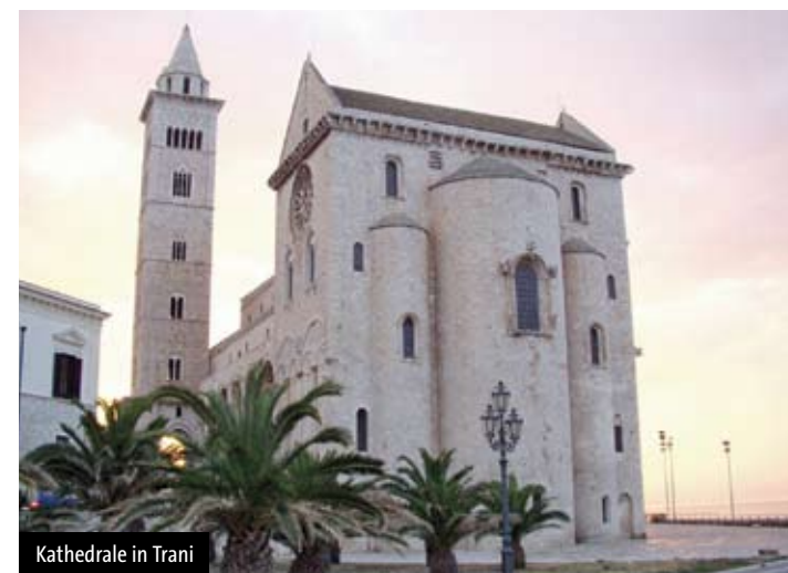
Kathedrale in Trani

Kragkuppel) besonders gut erhalten hat. Fahrt nach Ostuni , der „Weissen Stadt“. Spaziergang durch die malerischen Gassen hinauf zur Kathedrale. Abendessen und Übernachtung Raum Alberobello .