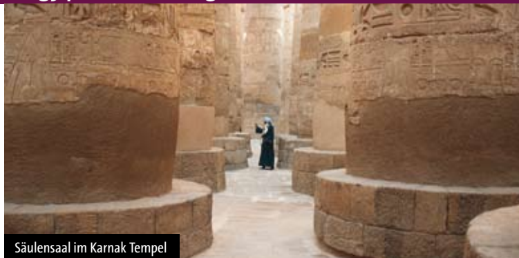
Säulensaal im Karnak Tempel

tenen Tempelbauten in Ägypten. Fahrt nach Luxor . A/Ü Luxor .