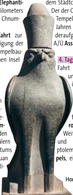
Horusstatue in Edfu

Fahrt nach Kom Ombo und Besichtigungen im großen Doppelheiligtum des krokodilköpfigen Sobek und des falkenköpfigen Haroeris . Anschließend Weiterfahrt nach Edfu und Besichtigung des ptolemäischen Horustempels , einer der besterhal-