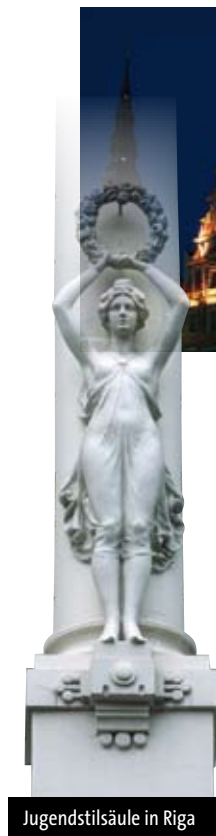
Jugendstilsäule in Riga