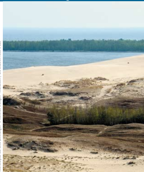
Foto: Skulptur auf Seite „Leistungen“ © Matthias Krüttgen - Fotolia.com / alle anderen Fotos © ECC

5. Tag: Fahrt über das Haff zur Rundfahrt und Besichtigung von Klaipeda , der drittgrößten Stadt Litauens. Klaipeda ist Litauens „Tor zur See“. Zu den Sehenswürdigkeiten der Stadt zählen die historische Altstadt mit ihren Fachwerkhäusern, das Schauspielhaus, der Simon-Dach-Brunnen mit der Ännchen-von-Tharau Figur und die ehemalige kaiserliche Hauptpost. Weiterfahrt nach Siauliai zur Besichtigung einer der bedeutendsten Sehenswürdigkeiten Litauens, des „Berges der Kreuze“. Weiterfahrt über die lettische Grenze Richtung Bauska zum Schloß Rundale aus dem 18. Jh., das