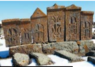
Kreuzsteine in Noratus

Orientierende Stadtrundfahrt in Eriwan , der Hauptstadt Armeniens: Cascade (große Freitreppe); von oben prächtige Aussicht auf