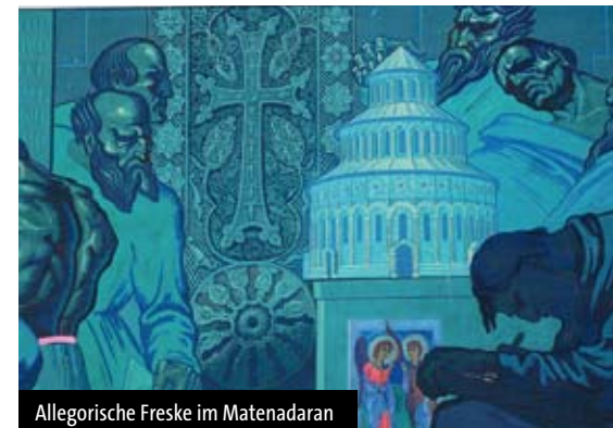
Allegorische Freske im Matenadaran